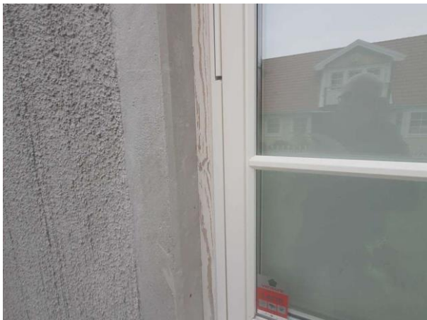
Bild 1: Utvändigt, Fönster, Framsida, Fönster av isolerglasmodell samt 2 glas kopplade. Ommålningsintervall är ca 7–10 år, den kortare tiden i söderläge (mot solsida). Isolero...