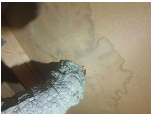
Bild 4: Invändigt, Övervåning, Vind, Vinden används som förvaring vilket utgör en risk för förhöjd fuktighet. Fuktfläckar noterades runt ventilationsgenomföringen.