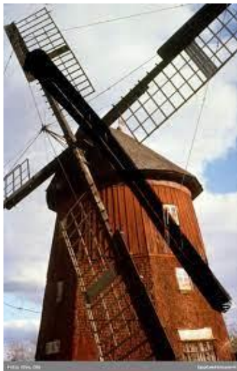
Kvarnen i Högby