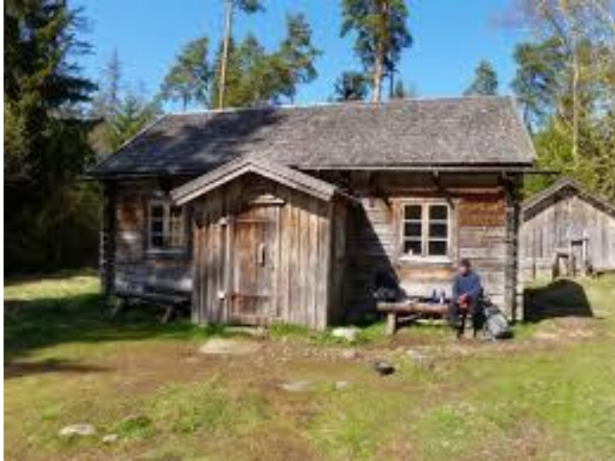
Ett gammalt torp man kan övernatta i längs med Upplandsleden (mellan Lagga och Ängby)